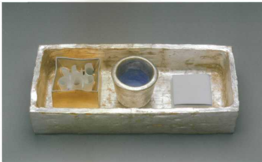
Márta Nagy, Winter Day (uit serie Closed Gardens ), 2007; steengoed, porselein, bladgoud en -zilver; 7,5 x 32 x 13,5 cm.