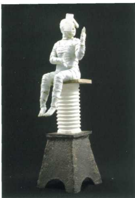
Mary Kershaw, Palm Reading , 2008; porselein en aardewerk; h. 39 cm.

meer dat die op koestering kunnen duiden, het uiterlijk kunnen verbergen of iets walgelijks, een metamorfose kunnen symboliseren of een verborgen persoonlijkheid, een diepere waarheid kunnen verbergen ... Tot slot schrijft zij dat de beschouwer zijn interpretatie moet vinden vanuit zijn eigen referentiekader. En dat is waar Kershaw vooral naar streeft.