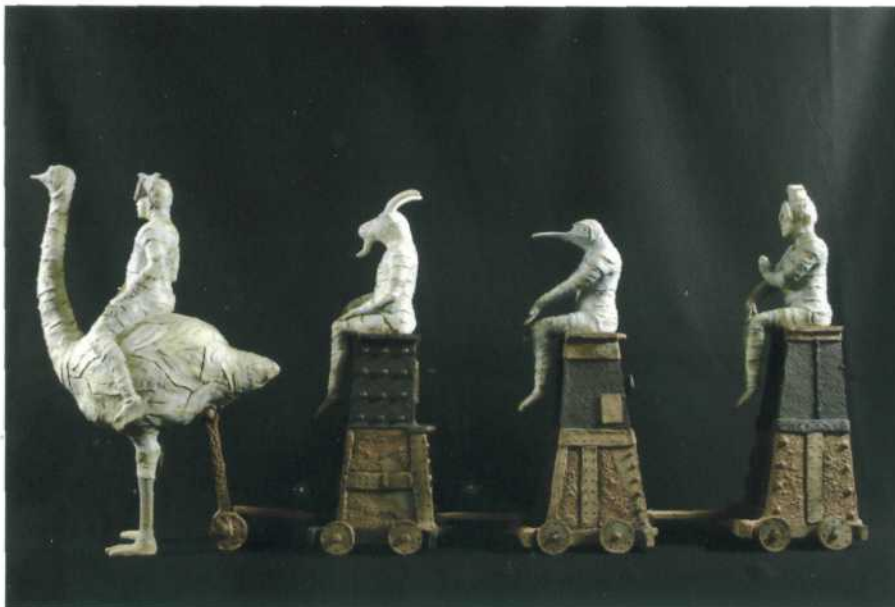
Mary Kershaw, Last Train to Level VII , 2009; porselein en aardewerk; h. 48,5 cm.

contact: info@rjamesstudio.co.uk ; www.rjamesstudio.co.uk