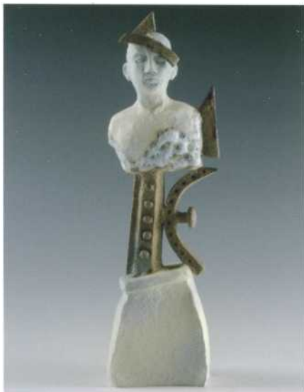
Mary Kershaw, Fragments , 2010; porselein en aardewerk; h. 27,5 cm.