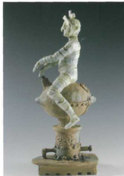
Mary Kershaw, Lemon Juice , 2010; porselein en aardewerk; h. 37,5 cm.