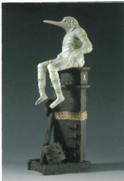
Mary Kershaw, Feet Too Flat , 2009; porselein en aardewerk; h. 38,5 cm.