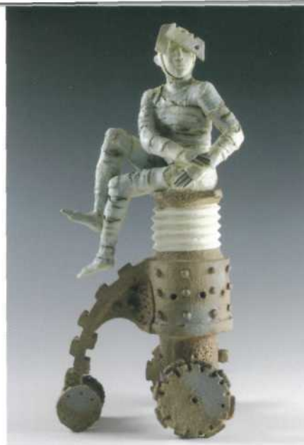
Mary Kershaw, Juice Container. Level II , 2010; porselein en aardewerk; h. 36 cm.

meer dat die op koestering kunnen duiden, het uiterlijk kunnen verbergen of iets walgelijks, een metamorfose kunnen symboliseren of een verborgen persoonlijkheid, een diepere waarheid kunnen verbergen ... Tot slot schrijft zij dat de beschouwer zijn interpretatie moet vinden vanuit zijn eigen referentiekader. En dat is waar Kershaw vooral naar streeft.